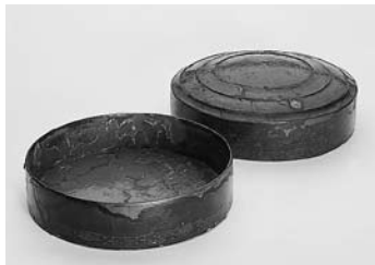
方格規矩鏡【国宝】/平原墓 伊都国歴史博物館保管/文化庁所蔵(上) 青銅製鼎/楽浪土城 東京大学文学部考古学研究所蔵(中左) 鏡奩/王盱墓 東京大学文学部考古学研究所蔵(中右) 楽浪系土器/御津港沖(海上がり) 松江市教育委員会所蔵(下左) 加飾壺/ホケノ山古墳 当研究所所蔵(下右)